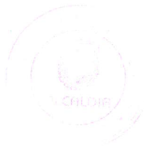
Arq. Fernando Callejas Barona ALCALDE DE AMBATO